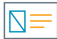
cartes en plastique

Téléchargez l'édition Free sur fr.BarTenderSoftware.com