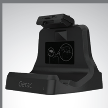
Station d'accueil bureau