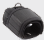
▪ 11-0109 PowerHood